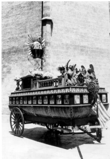
LA ROCA DEL SANTO CÁLIZ

Notorio es al mundo aquel prodigioso milagro que sucedió en este Reino, junto al lugar de Luchent en el año 1.239, donde Cristo Sacramentado quiso manifestar su verdadera existencia de carne y sangre, en aquellas seis Formas consagradas, rubricando los Corporales con ella, que hoy se veneran con religioso culto en la ciudad de Daroca: juntándose a ésta otra igual maravilla, que en este mismo tiempo sucedió, nacida de la poca fe de un Sacerdote que celebrando el Altísimo Sacrificio de la Misa, en Castro Bulsino, junto a Viterbo, dudó de la real existencia del Cuerpo de Cristo en la Hostia; permitió Dios para confusión suya y crédito de nuestra Santa